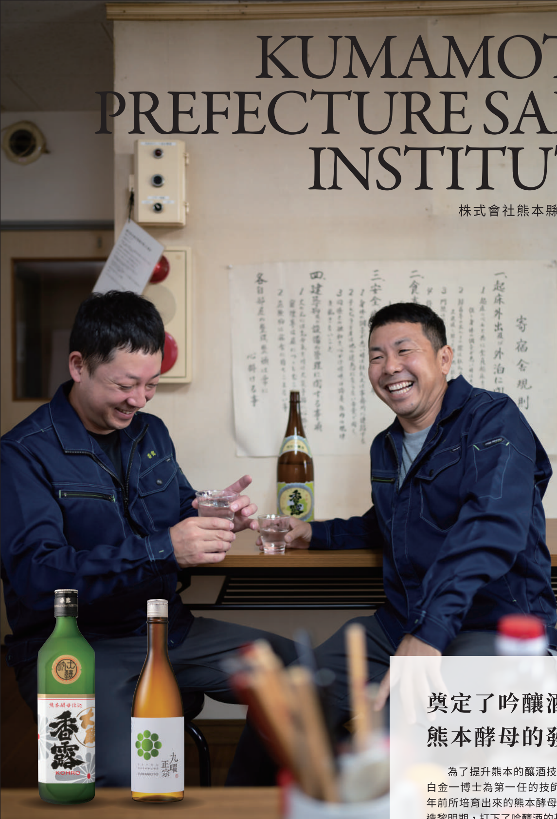
左：香露 / 大吟釀酒

全部使用山田錦米。口感穩重且圓潤，滑順口感中帶有果香。被評為吟釀酒的經典範本，能感受到作為先驅者的自豪感。