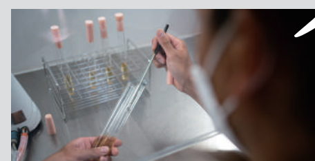
上・下／培養熊本酵母的樣子 驚人的發酵力最適合釀造香味濃郁的清酒