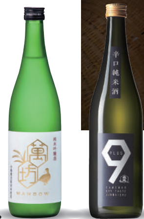
左：萬坊 / 純米吟釀酒

家族世代為醫生的家世。用稻米來代替醫療費而開始釀酒事業，是困難重重的開始。不適合釀造日本酒的南國氣候、含鐵分多的水源。自己想出獨自的釀酒方式，不畏逆境，釀出了濃郁美味的酒品。再加上龜萬酒造的竹田瑠典先生的足智多謀，以花酵母讓釀造實踐了新的方向，相繼的將其商品化。也讓它在南端佔有一席之地。