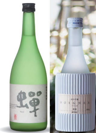
左：蟬 / 純米吟釀酒

仿自酒莊旅遊的領導酒莊納帕谷酒莊。通潤酒造的山下愛子女士在釀酒的同時，也藉由藏咖啡館的模式促進地區發展。在山都町，結合地區、酒藏與人的滯留型酒藏旅遊。山下家與負責建造地標—通潤橋的布田保之助有著親戚關係。冠上國寶之名的酒藏，在城鎮建設上注入了創新的一滴，即將會掀起一陣大浪潮。