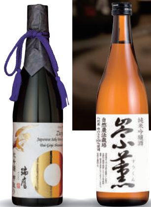
左：大吟釀 舉取 YK35/ 大吟釀酒

全部採用山田錦 (Y)、熊本酵母 (K)、精米比例 35% (35)。酒釀不加壓的方式，以自然滴落來製作。這是一款極盡奢華的精湛臻品，展現了酒藏的理念。