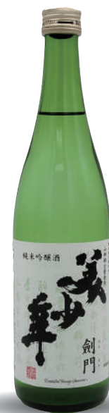
劍門 / 純米吟醸酒

其名稱源自三國志中所敘述的難攻不破要塞——劍門關。全部採用山田錦，口感醇厚外，其後韻清爽，會讓人聯想到陡峭的山壁。