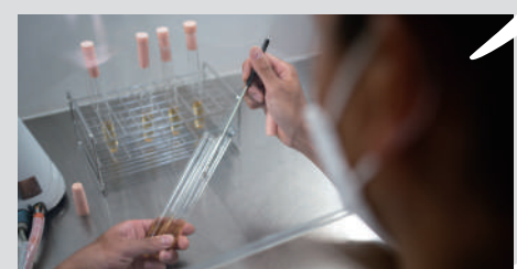
상·하 / 구마모토 효모의 배양 모습 발효력이 강하고 화려한 향의 술을 만드는데 적합하다.